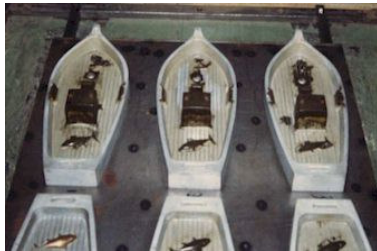
© Musée du Jouet - Moirans-en-Montagne

Le thermoformage consiste à plaquer une feuille de thermoplastique ramollie sur les parois d'un moule pour lui en faire prendre la forme. La matière est insérée dans le moule, maintenue dans un cadre ; elle est alors chauffée 40 secondes. Le moule mâle est ensuite mis en mouvement, de bas en haut. Afin de plaquer la feuille contre les parois dudit moule, un aspirateur par pompe à vide est utilisé. Lors de cette phase, la feuille, ramollie, prend la forme du moule. Au terme de cette opération, l'opérateur récupère la pièce et la laisse refroidir.