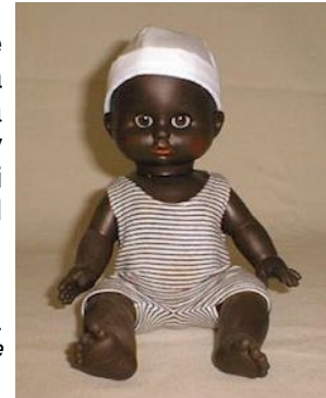
Baigneur en vinyle, Petitcollin, Etain, 1996.

- le polychlorure de vinyle (ou PVC) est léger, de bonne adhérence ; il résiste à la déchirure, ne se déforme pas ; les enfants apprécient sa souplesse, sa douceur et son parfum. Par ailleurs, il imite bien la peau et permet la réalisation de détails, en particulier au niveau du visage ; il est possible d'y faire des trous afin d'y implanter des cheveux ou des tuyaux, donnant ainsi des fonctions (pleurer, boire, marcher...). Ces raisons expliquent pourquoi il est privilégié dans la fabrication des poupées.