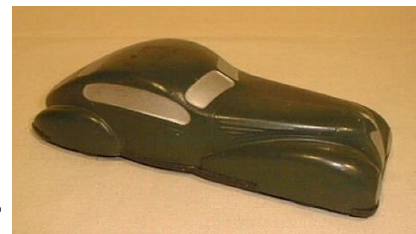
Voiture en celluloïd thermoformé, Monneret, Lons-le-Saunier, 1955. © Musée du Jouet - Moirans-en-Montagne

- D'autres industriels ne s'intéressent pas encore réellement aux jouets ; ceux-ci ne représentent qu'une infime part de la production totale. Ainsi, chez Moquin & Breuil , les jouets d'été ne représentent que 25% du chiffre d'affaires.