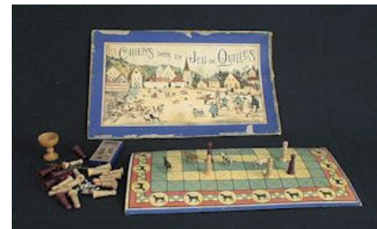
© Musée du Jouet - Moirans-en-Montagne

"Les chiens dans un jeu de quilles", J.L.R., Paris, vers 1915. >