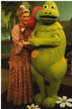
© Y. Brunier - C. Izard

- L'arrivée de Léonard le renard sur l'île, en avril 1976, est la conséquence de l'un de ses paris, qui consistait à creuser le plus grand terrier du monde. Or, la sortie s'est effectuée dans la malle de Casimir , sur L'Île aux Enfants , dans laquelle il décide de vivre ! Avant de n'être un renard rusé, opportuniste, grognon et gourmand, Léonard est une marionnette à gaine, dessinée par Yves Brunier pour les séquences de Toba et les autres , et animée par Boris Scheigam. Les positions que prend le marionnettiste pour l'animer sont des plus originales : il est tantôt allongé sur le châssis de la voiture rouge de Léonard , tantôt à genoux dans la malle de Casimir . Faire des farces à Casimir est l'activité favorite de Léonard sur l'île.