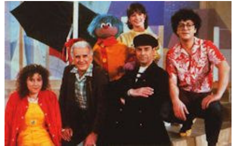
© Y. Brunier - C. Izard