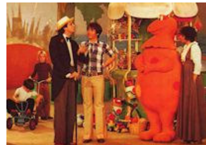
© Y. Brunier - C. Izard

Ainsi, le dinosaure orange Casimir , animé par Yves Brunier, est le personnage central des histoires. Il est drôle, farceur, un peu naïf quant à ce qui se passe dans le monde, mais vif d'esprit, spontané et généreux. Ses principaux défauts sont sa gourmandise - il ne pense qu'à manger son Gloubi Boulga - sa curiosité et sa maladresse. Sur l'île, Casimir se promène, chante, danse, joue avec les enfants, discute avec eux et organise des jeux. Il prépare également lui-même son Gloubi Boulga , avec du chocolat rapé, une banane écrasée, de la confiture de fraise, de la moutarde de Dijon et une saucisse de Toulouse crue mais tiède ; il y ajoute parfois, selon son humeur, de la chantilly ou quelques anchois. Dès les premières émissions, il est entouré, dans L'Île aux Enfants , de quatre comparses.