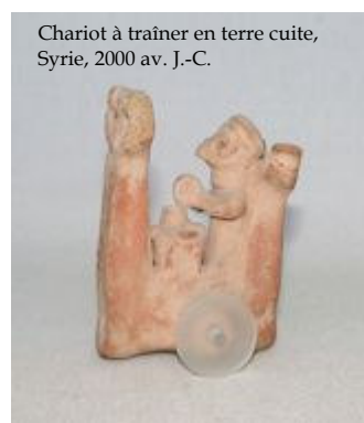
Chariot à traîner en terre cuite, Syrie, 2000 av. J.-C.

Plus âgés, alors qu'ils marchent, les enfants s'orientent vers de nouveaux jeux. Certains sont connus grâce aux représentations figurées sur les vases antiques, ou vases "chou". Ainsi l'on sait que les enfants aimaient les chariots, qui imitaient les moyens de transport. En Grèce, les chariots sont offerts pendant la fête des Antesthéries .