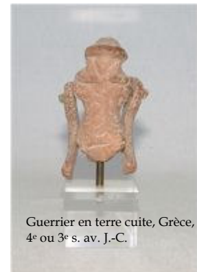
Guerrier en terre cuite, Grèce, 4 e ou 3 e s. av. J.-C.

La poupée de tradition hellénistique - la période hellénistique débute à la fin du 4 e siècle avant J.-C. -, présente dans la partie orientale de l'Empire romain jusqu'au 3 e siècle après J.-C., est dotée d'un corps creux et évasé dans sa partie inférieure, telle une jupe ; les jambes mobiles y sont suspendues par un fil. Les bras sont le plus souvent fixes, de sorte qu'ils peuvent tenir des accessoires, ou attributs. Les poupées sont caractérisées par cet accessoire ; elles peuvent ainsi représenter des musiciens, des danseuses ou danseurs, des comédiens, des soldats... Ce type de poupées a été retrouvé en Asie mineure, en Italie, en Crimée, dans le Royaume de Kertch, dans le monde Gréco-Parthe. Ces poupées, qui représentent des héros et des vedettes – soldats romains des 1 er et 2 e siècles retrouvés dans Olbia pontique, femmes gladiateurs attestées par des bas-reliefs... - annoncent déjà les poupées mannequins, les figurines Playmobil ,... des enfants d'aujourd'hui.