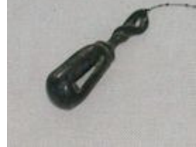
Hochet ajouré en bronze, Louristan, 2 e mill. Av. J.-C.

Les tintinnabula ont le même rôle que le hochet, mais sont plus rudimentaires. Généralement en bronze, ces sonnailles antiques sont accrochés au hochet lui-même ou au cou de l'enfant. On peut compléter cette liste de jouets musicaux avec le crotale , pièce de bois sur laquelle est articulée une planchette mobile qui claque, le sistre , fourche pourvue de trous en travers desquels passent des tiges de fer 'musicales', des vases en forme d'animaux, renfermant des cailloux, - ces vases ont été désignés par le grec Euboulos le comique sous le terme pséphopéribombétria (vase dans lequel un caillou fait du bruit en s'agitant autour de la cavité) -, la crécelle , ou platagé , inventée selon Plutarque par le philosophe Archytas.